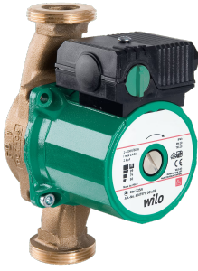
Simile alla figura